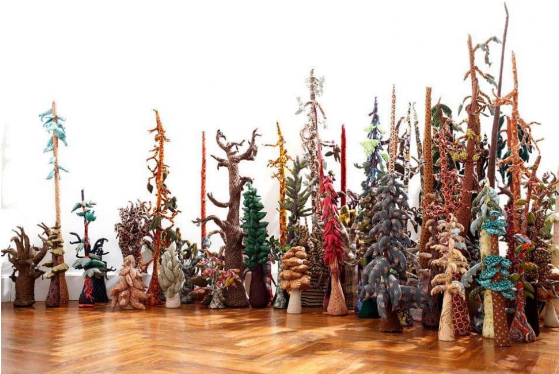
Suzanne Husky, Forest , 2010

Notre exploration de l'histoire écrite par les co-commissaires Pauline Ruiz et Jules Fourtine débute ainsi avec l'installation Forest (2010) de Suzanne Husky : soit une foule d'arbres en tissu, cousus à partir de textiles récupérés, bigarrés pour rappeler, nous expliquent-ils, « la diversité des espèces » que l'on peut trouver dans une véritable forêt.