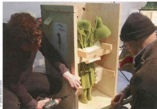
Le petit elfe dans la caisse