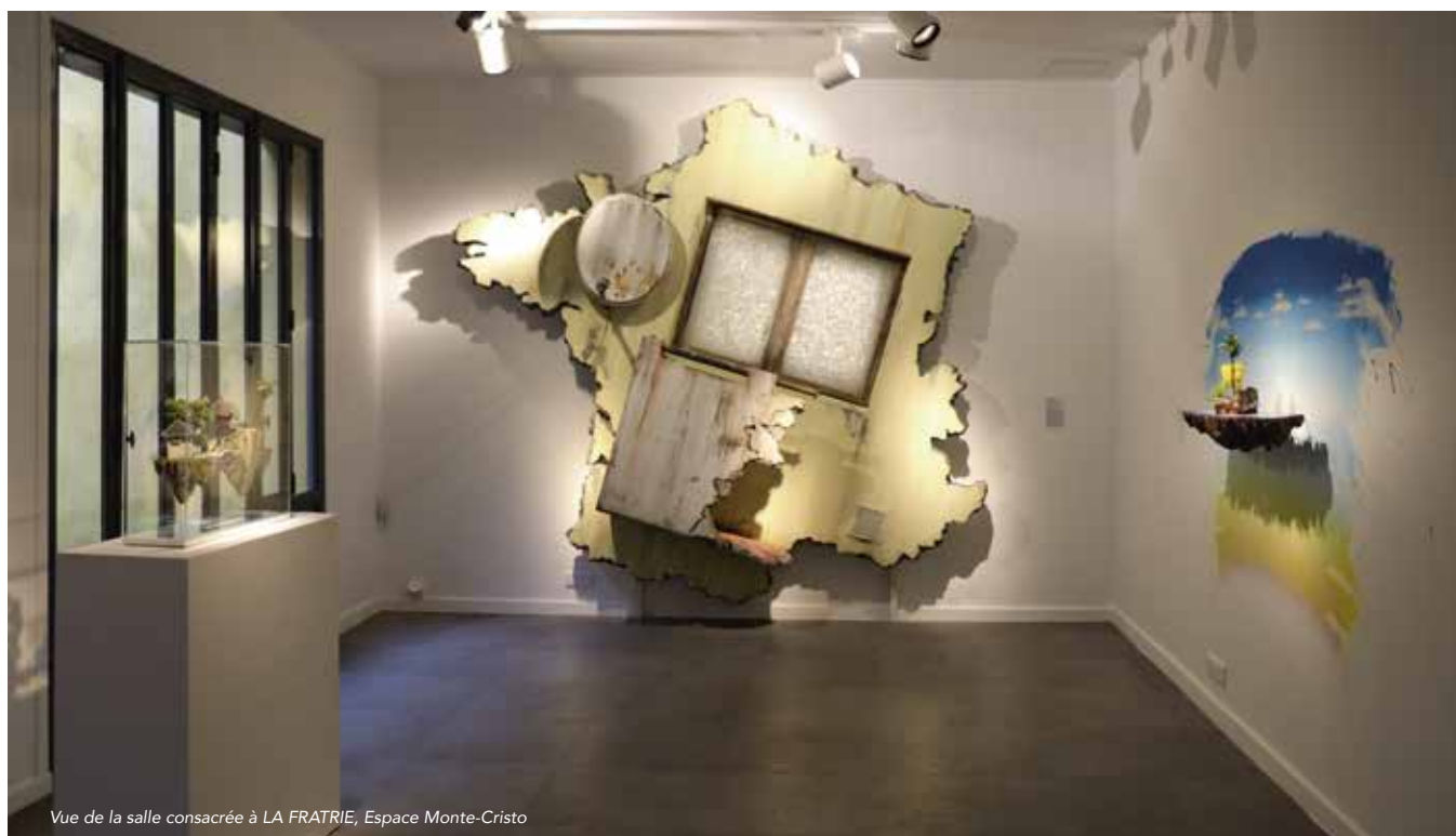
Vue de la salle consacrée à LA FRATRIE, Espace Monte-Cristo