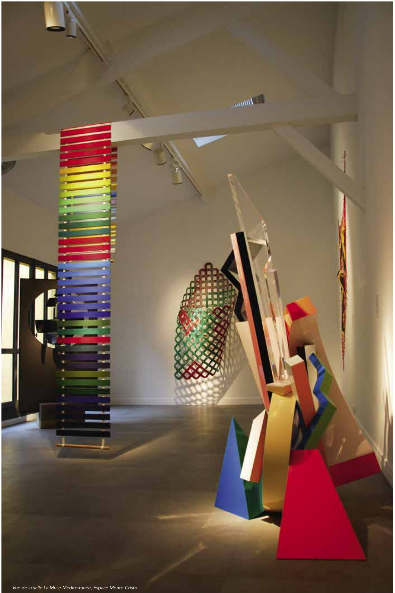
Vue de la salle La Muse Méditerranée, Espace Monte-Cristo